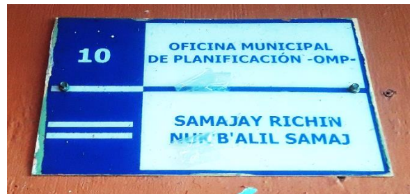
FOTOGRAFIA NO. 2