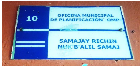
FOTOGRAFIA NO. 2