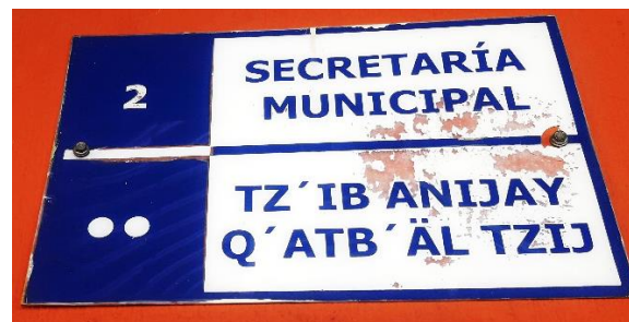
FOTOGRAFIA NO. 6