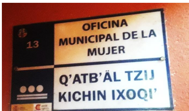
FOTOGRAFIA NO. 7