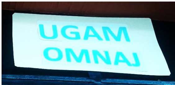
FOTOGRAFIA NO. 3